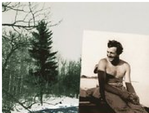
Ernest Hemingway Den orörda platsen